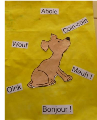
ILLUSTRATION DES ELEVES